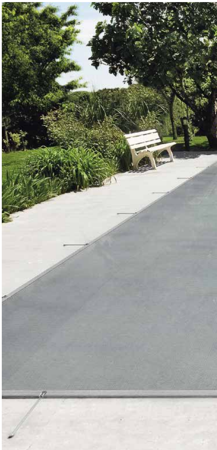
Herausgeberin: Bieri Gruppe, Schweiz Bild-Umschlag: Bieri Schuttenetz standard

Ihr Händler vor Ort: Votre distributeur: